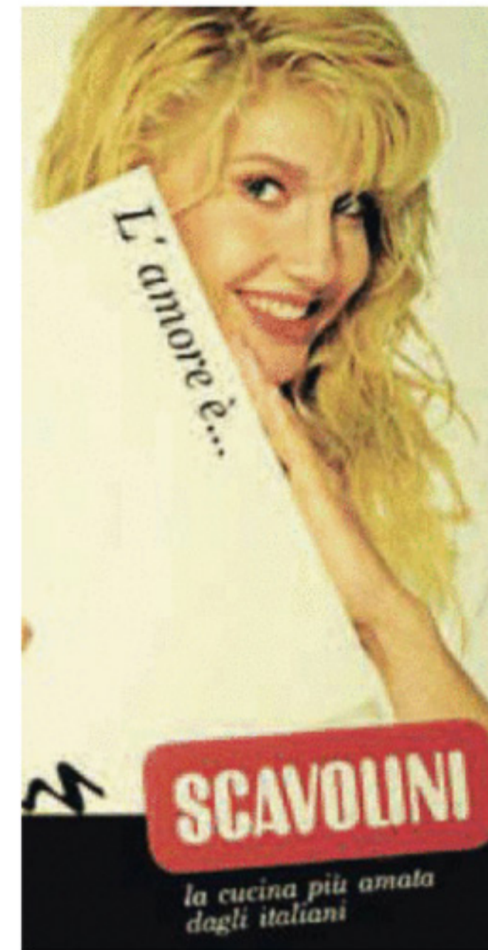
Accanto, un'immagine da una campagna pubblicitaria con Lorella Cuccarini, seconda testimonial storica dopo Raffaella Carrà delle campagne pubblicitarie dell'azienda

tante nella pubblicità: molta tv all'inizio, e negli anni Duemila la campagna "Kitchens", l'allegato in carta stampata che dalle riviste di settore è passato sui quotidiani raggiungendo una tiratura quasi virale di 20 milioni di copie.